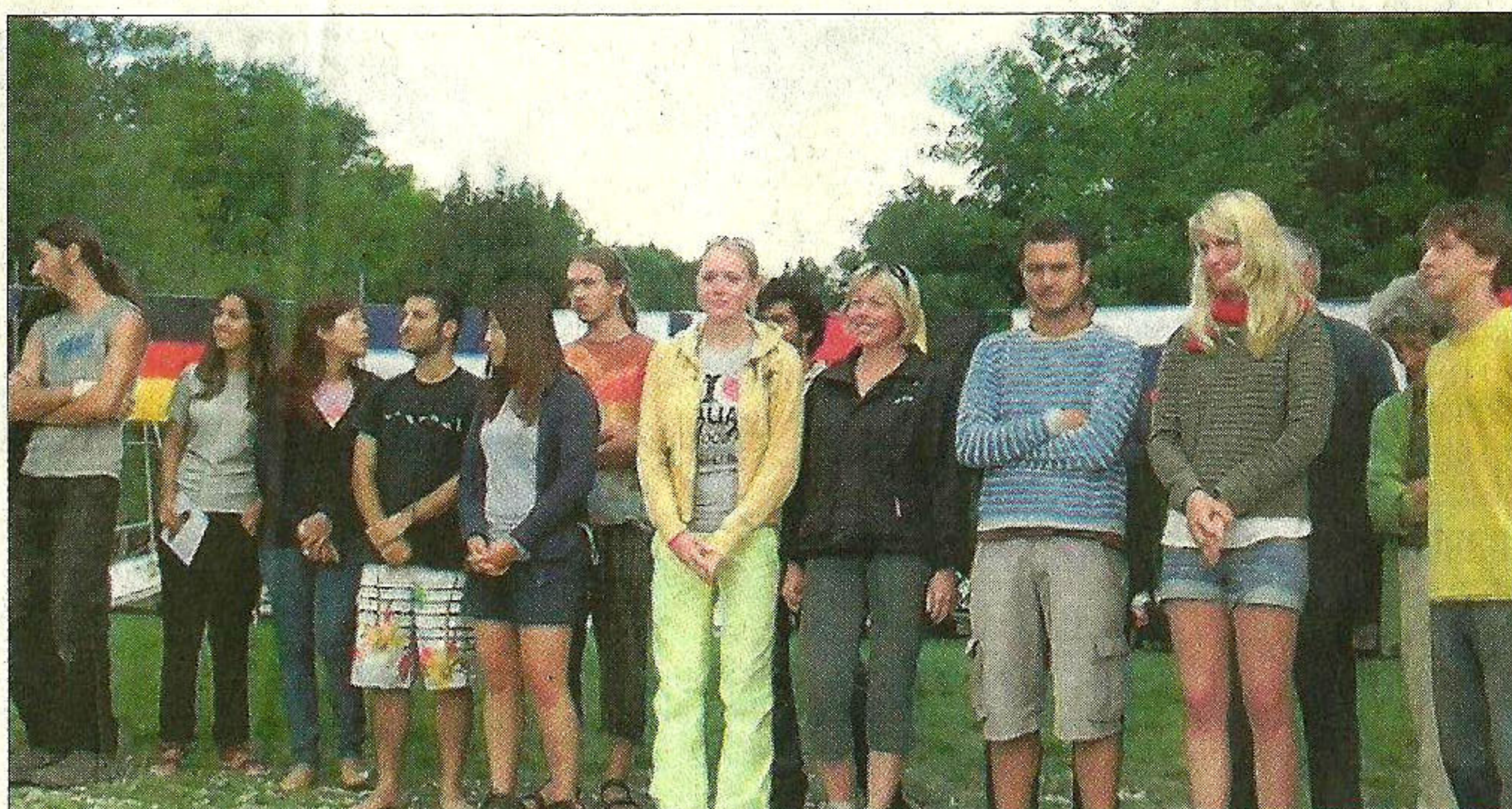
Les élus ont souligné la prouesse de ces jeunes internationaux (Tchèque, Britannique, Allemand, Coréen, Turc, Espagnol, Français), qui ont trouvé un langage universel au service d'une même passion.