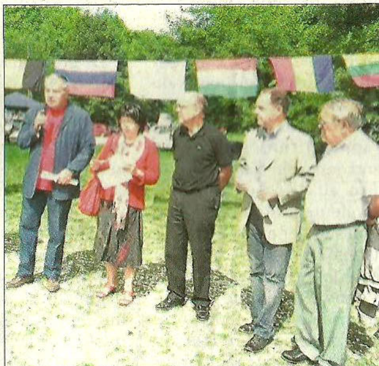
Les élus ont été unanimes à déclarer : « au-delà des travaux réalisés, l'enjeu, c'est aussi une découverte réciproque entre les habitants d'un territoire rural et des volontaires de tous les horizons ».